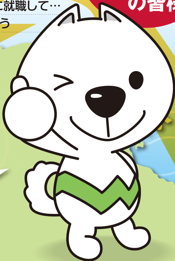
和歌山県PRキャラクター「きいちゃん」

和歌山には 日本や世界で活躍する 魅力的な企業がたくさんあるよ。 県内就職のメリットや県内企業のことを 知ってもらおうセミナーです。